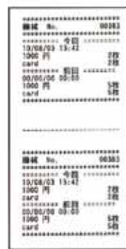
プリントイメージ